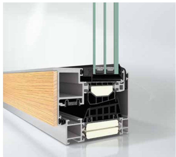
Schüco AWS 90 BS.SI+ WoodDesign Schüco AWS 90 BS.SI+ WoodDesign