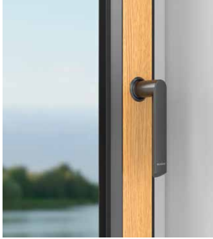
Steckgriff mit Rundrosette Push-in handle with round rosette