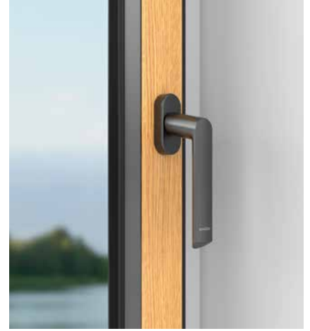
Griff mit ovaler Griffrosette Handle with oval rosette

Um die Holzoberflächen optimal zur Geltung zu bringen, wurden eigens für Schüco AWS WoodDesign zwei neue Anbindungen für die bekannten Schüco Steckgriffe entwickelt. Eine ganz neue Optik ergibt sich durch die Steckgriffrosette in eckiger Ausführung, die den Kontrast zwischen Holz- und Aluminiumprofiloberfläche als Stilelement aufgreift und verstärkt.