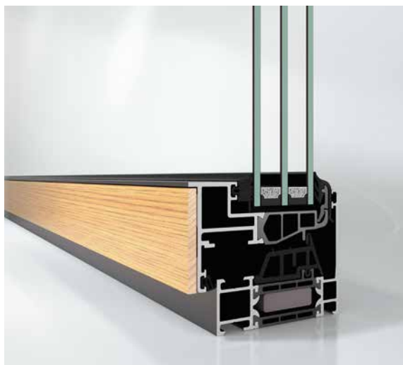
Schüco AWS 75 BS.SI+ WoodDesign Schüco AWS 75 BS.SI+ WoodDesign

A surface-mounted window handle with a 43 mm fixing distance can also be used. The lockable version of this handle can also meet burglar resistance requirements. All handles and their rosettes are available in the surface finishes Anodised C0, black and white.