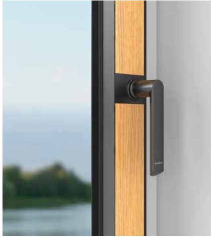
Steckgriff mit Rechteckrosette Push-in handle with rectangular rosette